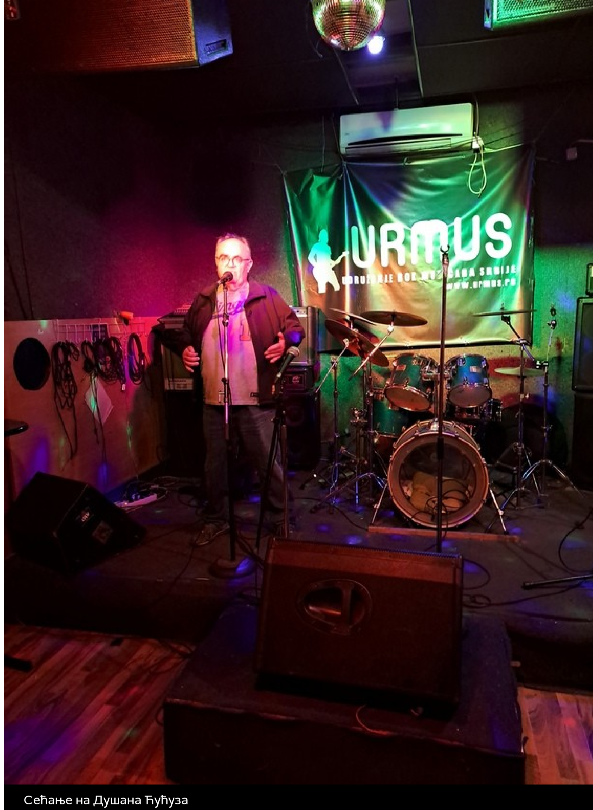
Сећање на Душана Ђуџуза

У Удружењу рок музичара Србије одржано је вече сећања на недавно преминулог музичара Душана Ђуџуза, оснивача и бас гитаристе групе Тако.